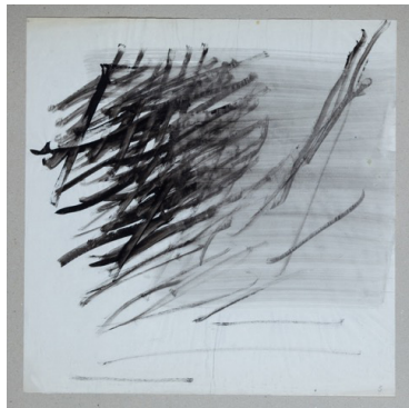
Alba Polenghi Lisca